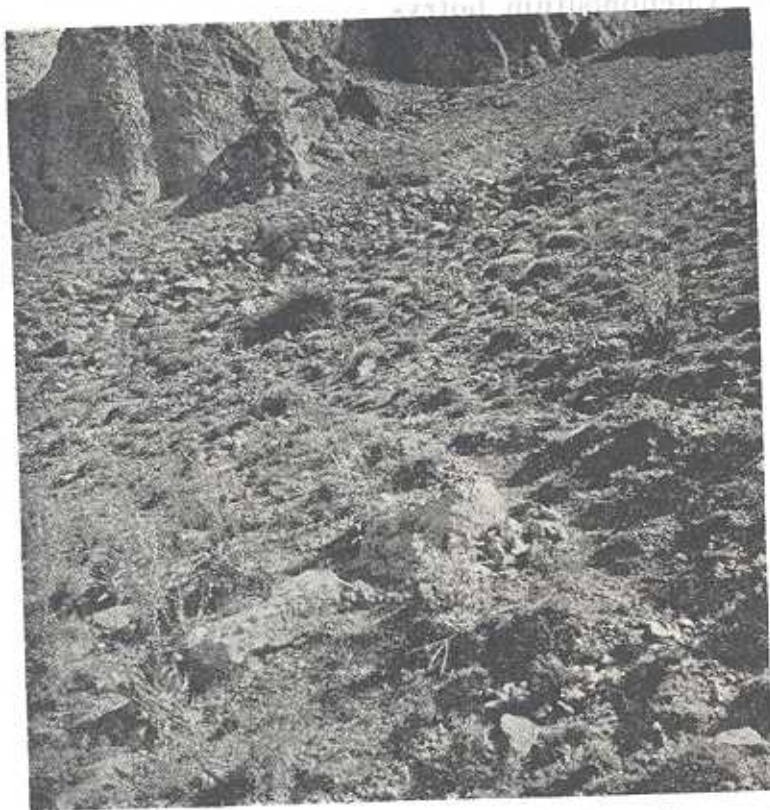
تصویر شماره ۱- اجتماع Acantholimon دامنه ارتفاعات آهکی از نو (در ارتفاع ۱۷۰۰ متر) متشکل از واریزه آهکی و خاک که در آن اجتماع آکاتولیمون همراه با گیاهان دیگری مانند Astragalus و Verbascum دریخته میشود.

1- Verbascum sp. 2- Astragalus 3- Acantholimon