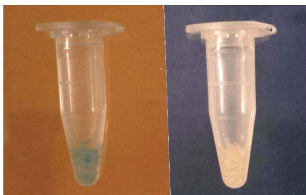
شکل ۴- بررسی آزمون GUS در گیاهان تراریخت شده در حضور سوبسترای X-Gluc ظهور رنگ آبی نشانگر بیان ژن GUS در گیاهان تراریخت (چپ) در مقایسه با گیاهان غیرتراریخت (راست) است