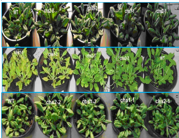
شکل ۱. گیاهان تحت تیمارهای دمایی متفاوت. الف) گیاهان شاهد، ب) گیاهان تحت تیمار سرما، ج) گیاهان تحت تنش سرما

ویژگی‌های مورفولوژیکی ناشی از دمای پایین در گیاهان جهش یافته آرابیدوپسیس تحت تیمار سرما مشاهده شد. تحت این تیمار دمایی برگ گیاهان جهش یافته زرد شد و پس از یک هفته قرارگیری در معرض تیمار سرما همه این گیاهان از بین رفتند و با بازگشت به دمای رشد نرمال زنده نماندند (شکل ۱ ب). تحت تنش سرما و شاهد گیاهان وحشی و جهش یافته ظاهر طبیعی داشتند و ویژگی مورفولوژیکی خاصی نشان ندادند (شکل ۱ الف ج).